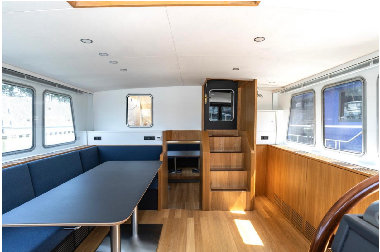
Obere Kabine, ideal für Meetings mit Weitblick