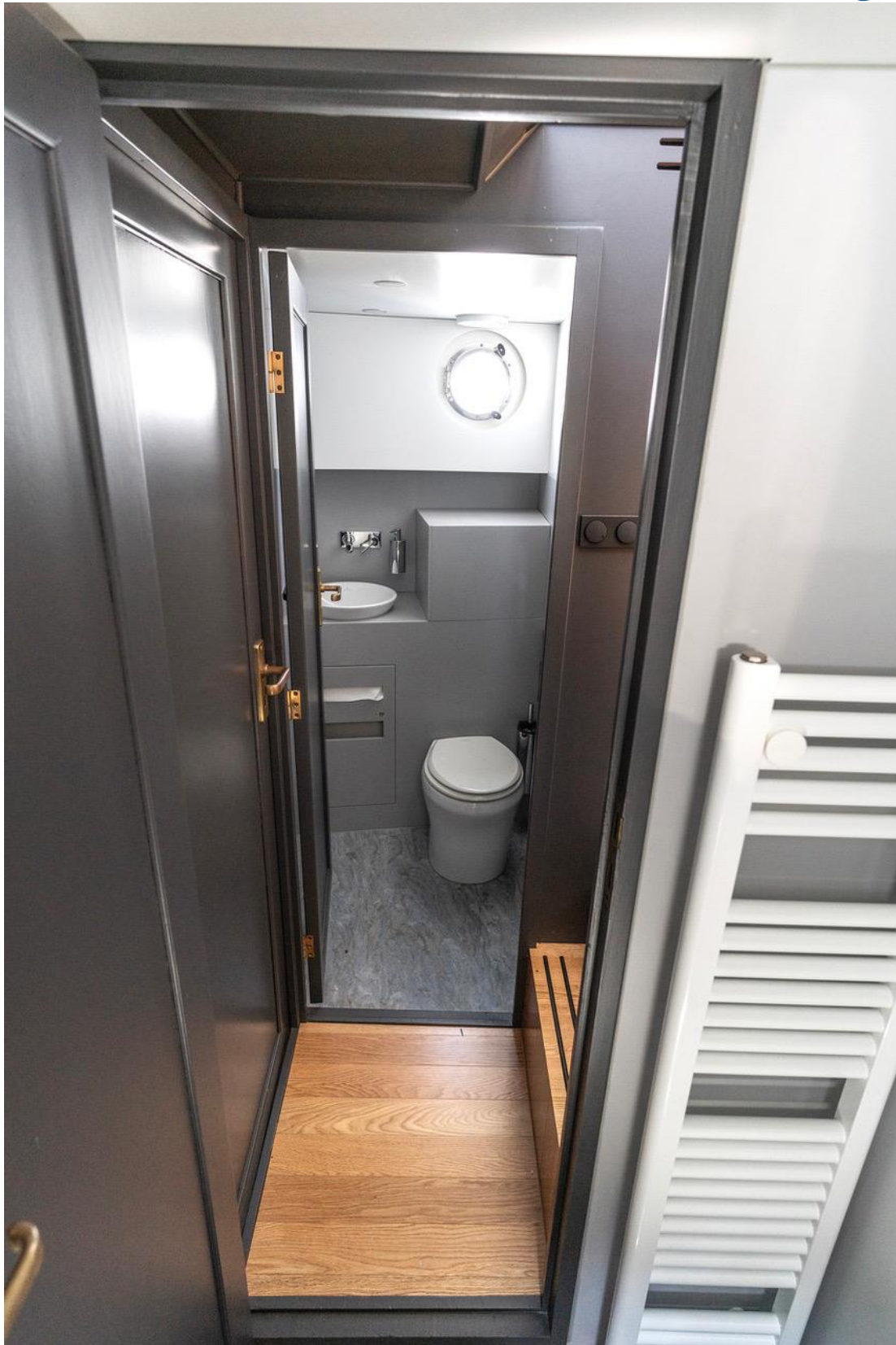
Neue Heizkörper im gesamten Schiff