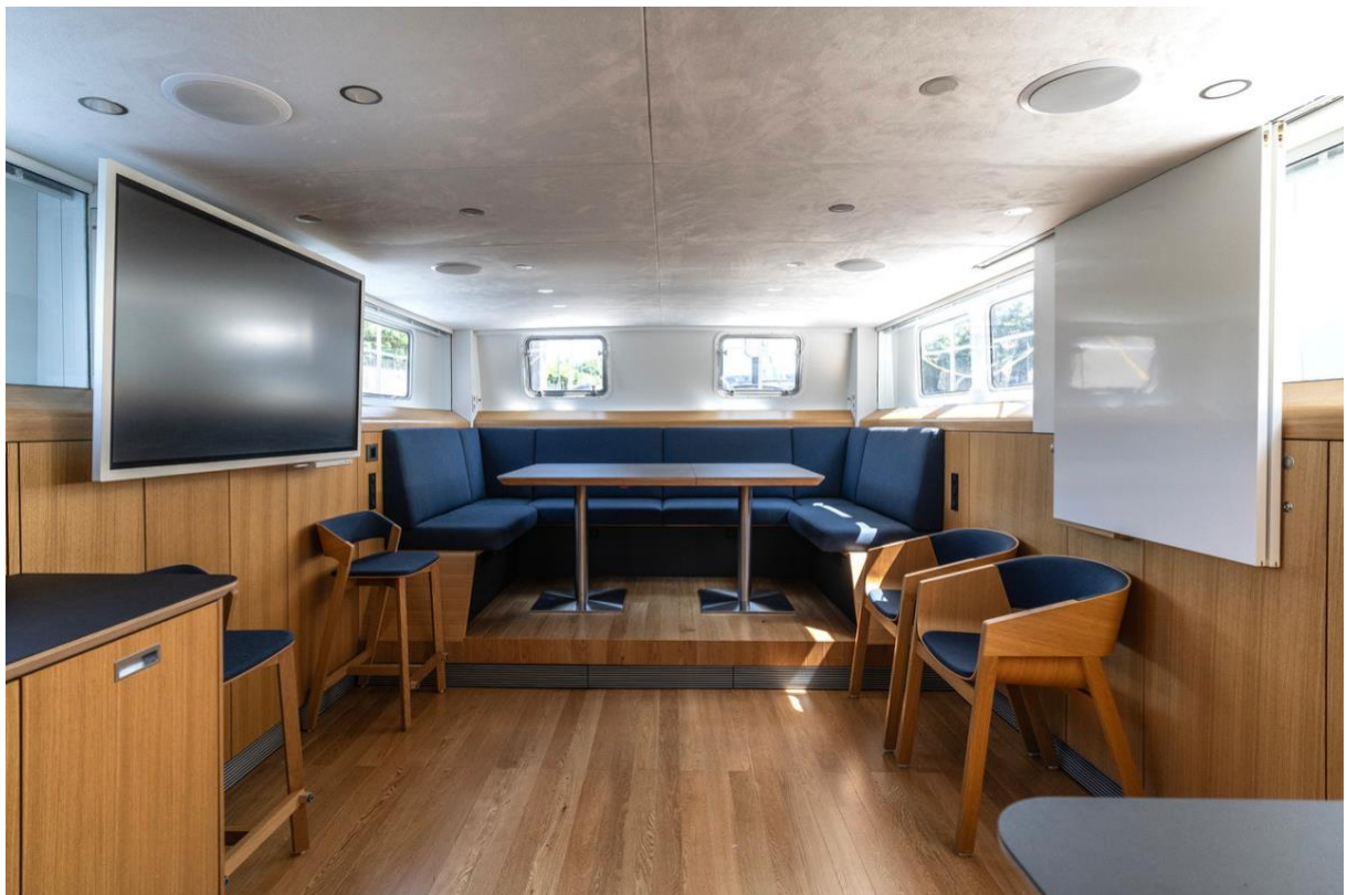
Unterer Konferenzraum mit Samsung Flipchart und Küche